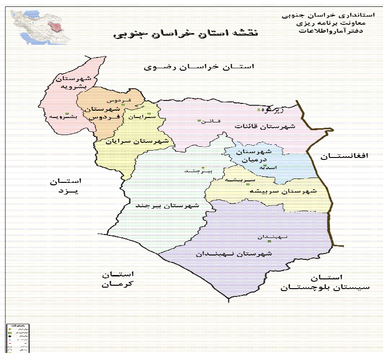
شکل ۵. نقشه استان خراسان جنوبی

در این مدل، جریمه کمبود کالا برای کالای ۱ و ۲ هر واحد ۱۰۰۰ تخمین زده شده است و ضرایب توابع هدف در روش معیار جامع برای سه تابع هدف اول ۰/۱ و برای تابع هدف چهارم ۰/۷ و همچنین مقدار I=1 در نظر گرفته می شود که بر اساس نظر خبرگان می باشد. همان گونه که در جدول (۱۱) دیده می شود در دوره اول سه شهر بیرجند، نهبندان و قاین به عنوان انبارهای موقت انتخاب می گردد، که این انتخاب با توجه به میزان تقاضا و هزینه جابه جایی بین مناطق مختلف یعنی مناطق آسیب دیده و مراکز تامین صورت گرفته است. در دوره بعد چون میزان تقاضاها تغییر می کند بنابراین، مدل تصمیم به ایجاد یک انبار موقت جدید در شهرستان فردوس می نماید. همچنین با بررسی جدول (۱۲) مشاهده می شود که در اکثر حالات، سعی شده است کل تقاضای هر منطقه آسیب دیده از طریق یک انبار موقت تامین گردد؛ زیرا این امر موجب کاهش هزینه های جابه جایی می گردد. با بررسی نتایج حاصل از مدل و داده های ورودی مساله مشاهده می شود استقرار انبارهای موقت بر اساس میزان فاصله از تامین کننده و همچنین فاصله انبار موقت با مناطق آسیب دیده صورت می پذیرد. همچنین بر اساس تابع هدف دوم مدل سعی می شود همه مناطق آسیب دیده تا حدودی با نسبت برابر کالا دریافت کنند تا رعایت انصاف در توزیع کالا صورت گرفته باشد.